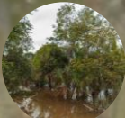
Bosques de galería y bosque de inundación