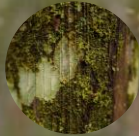
Especies nativas maderables